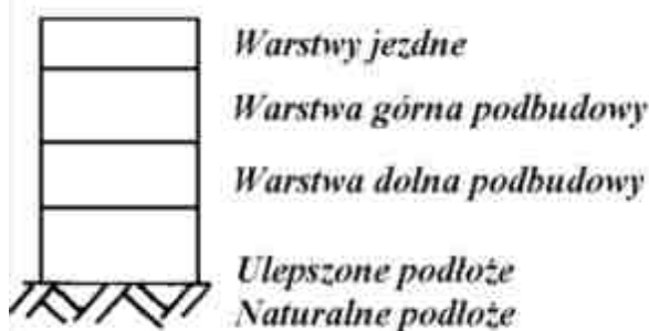
Rys. 3. Konstrukcja nawierzchni utwardzonego pobocza